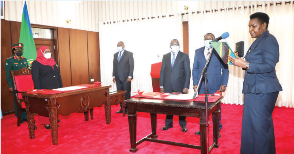
Mhe Dkt Samia Suluhu Hassan Rais wa Jamuhuri ya muungano wa Tanzania akimwapisha Dkt Angeline S.L. Mabula kuwa Waziri wa Ardhi, Nyumba na Maendeleo ya Makazi