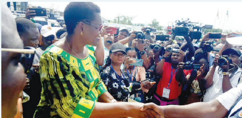
Nikipokea cheti cha ushindi toka kwa msimamizi wa uchagu haonekani katika picha kabla yakuongea na waandishi wa habari