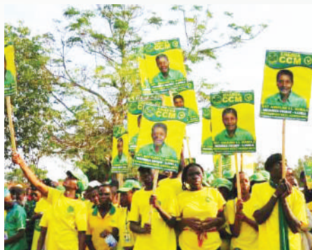
Baadhi ya vijana wa hamasa wakiwa wameshika mabango ya mgombea ubunge wa CCM katika uchaguzi wa Octoba 2020