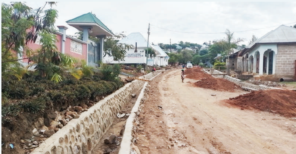
Ujenzi wa barabara ya Bigbite – Michungwani (1.3KM)