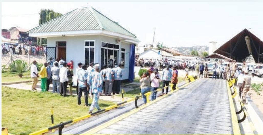
Mzani wa kupima Mazao ya Samaki Mwaloni - Kata ya Kirumba umekamilika na unatoa huduma.

Lengo ikiwa ni kupunguza utegemezi wa kibajeti kwa kuimarisha mifumo ya ukusanyaji wa mapato ya ndani, ikiwemo kuibua vyanzo vipya vya mapato. Manispaa ya Ilemela ilimepewa kipaumbele sana katika suala la miradi ya kimkakati, lengo ikiwa ni kukuza uchumi wa nchi kupitia ujenzi wa miundombinu hususa ni miundombinu inayobeba miradi ya vielelezo inayo weza kutoa ajira kwa watu wengi, lakini pia uchangiaji wake katika pato la taifa ukizingatia Mkoa wa Mwanza ni hub ya nchi za maziwa makuu. Baadhi ya miradi ya kimkakati iliyotekelezwa au inayoendelea kutekelewa ni pamoja na ifuatayo;