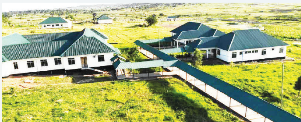
Sehemu ya majengo ambayo yamekamilika katika Hospital ya wilaya ya Ilemela, ujenzi wa miundombinu bado unaendelea.

Maelekezo ya ilani ya uchaguzi yalielekeza ujenzi wa hospital za wilaya. Manispaa ya Ilemela ilianza ujenzi wa Hospital ya wilaya,. Awamu ya sita chini ya Mhe. Dkt Samia Suluhu Hassan alianza ujenzi wa awamu ya pili wa hospitali ya halmashauri; lengo ikiwa ni kuhakikisha huduma za afya zinaboreshwa ngazi yawilaya ili kupunguza vifo vinavyoweza kuzuilika kwa wagonjwa. Lengo lingine ilikuwa ni kupunguza vifo vya mamana mtoto kwa kushughulikia Rufaa zinanotoka Zahanati na Vituo vya Afya kwa ukaribu. Majengo yaliyokamilika hadi sasa ni; Jengo la utawala, Wagonjwa wa nje (OPD), Stoo ya dawa, Jengo la mionzi, Maabara, jengo la kufulia/usafi na jengo la wazazi . Awamu ya pili ya ujenzi wa wodi ya wanaume na wodi ya wanawake na kichomea taka upo katika hatua za mwisho za ukamilishaji, jengo la kuhifadhia maiti limekamilika. Ununuzi wa dawa na vifaa tiba unaendelea, na baadhi vimeanza kupokelewa kama inavyoonekana hapa.