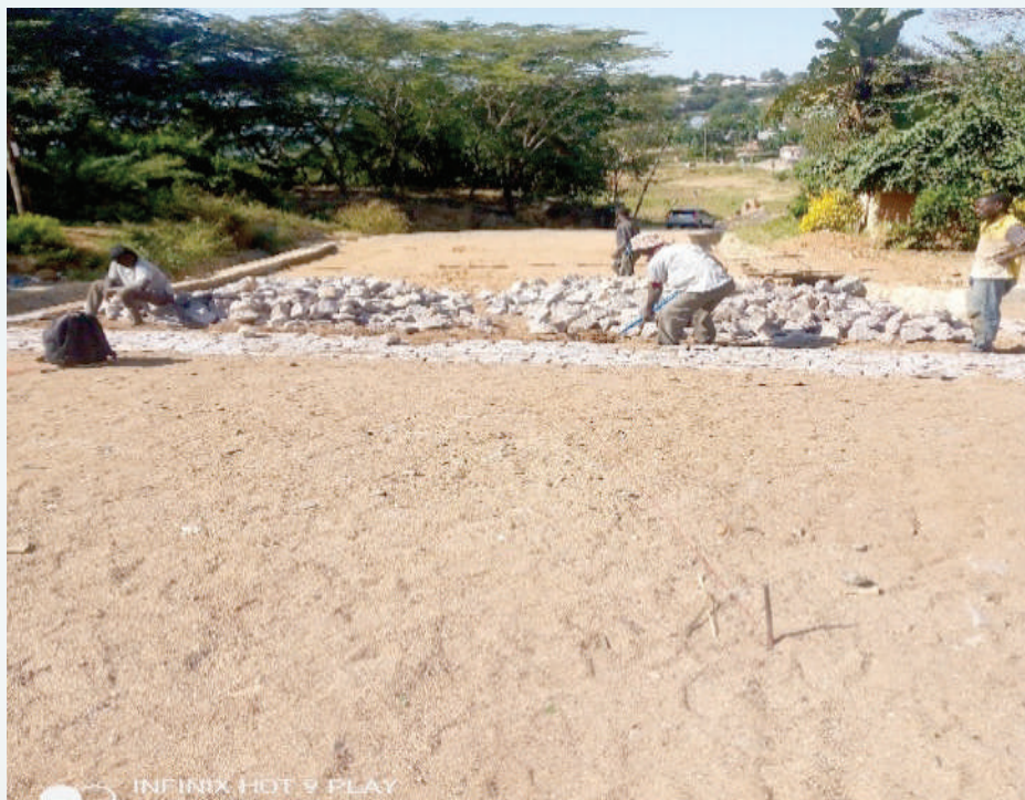
Ujenzi wa daraja la Kilunguja Kata ya Kiseke na barabara ya Jiwe kuu kwa kiwango cha mawe Kata ya Kitangiri