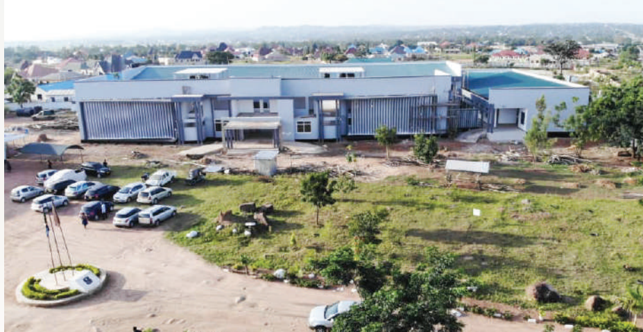
Jengo la utawala kwa muonekano wa juu na mbele, ujenzi unaendelea vizuri