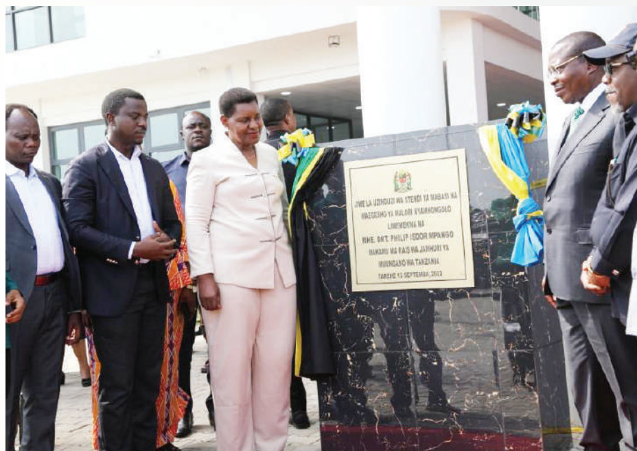
Hafu ya uzinduzi wa kituo cha mabasi na malori cha nyamhongolo uliofanya na Makamu wa Rais Dkt Philip I. Mpango, pempeni yake baashi ya viongozi walioshiriki

Mradi una vyanzo vifuatavyo vya kukusanyia mapato; Jengo la Abiria, Jengo la Biashara, Maegesho ya Malori , na Hostel kwa ajili ya kulalawageni.