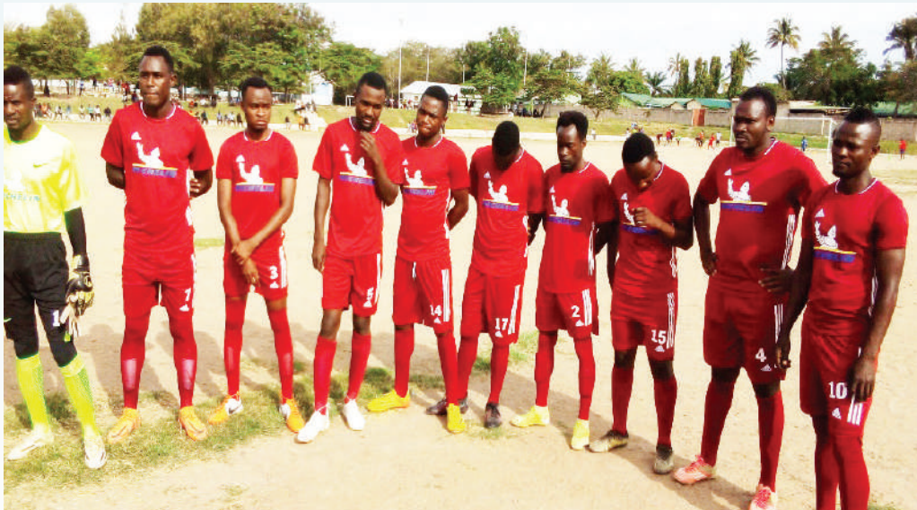
Timu ya mpira wa miguu toka Kata ya Nyasaka walioshiriki mashindano ya The Angeline Jimbo Cup 2022