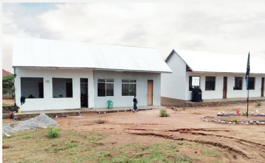
Shule mpya ya sekondary ya Nyamhongolo, ujenzi wa miundombinu unaendele