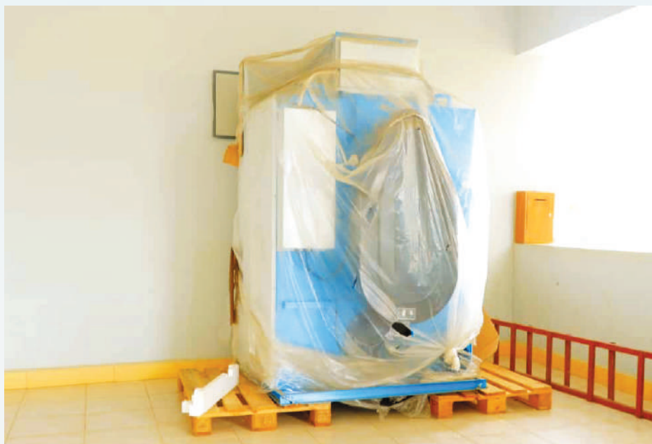
Mashine ya kufulia nguo za wagonjwa ktk Hospital ya wilaya