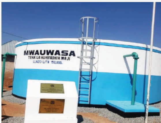
Tenki la Mlima wa Rada lenye ujazo wa lita 150,000