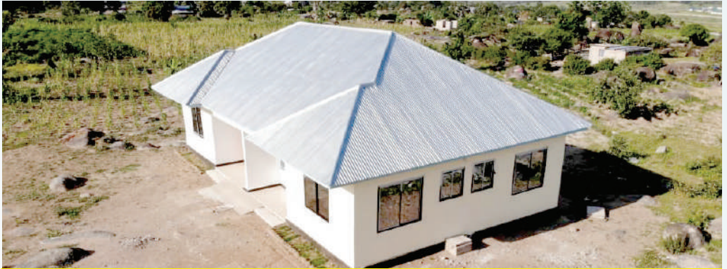
Nyumba wa walimu 2:1 shule ya msingi Isanzu