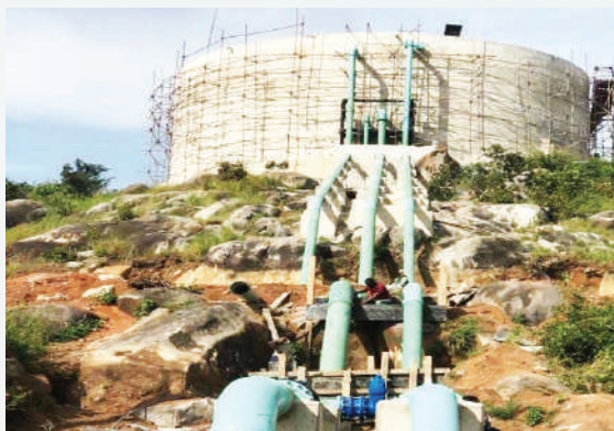
Tenki la Buswelu lenye ujazo wa lita 3,000,000