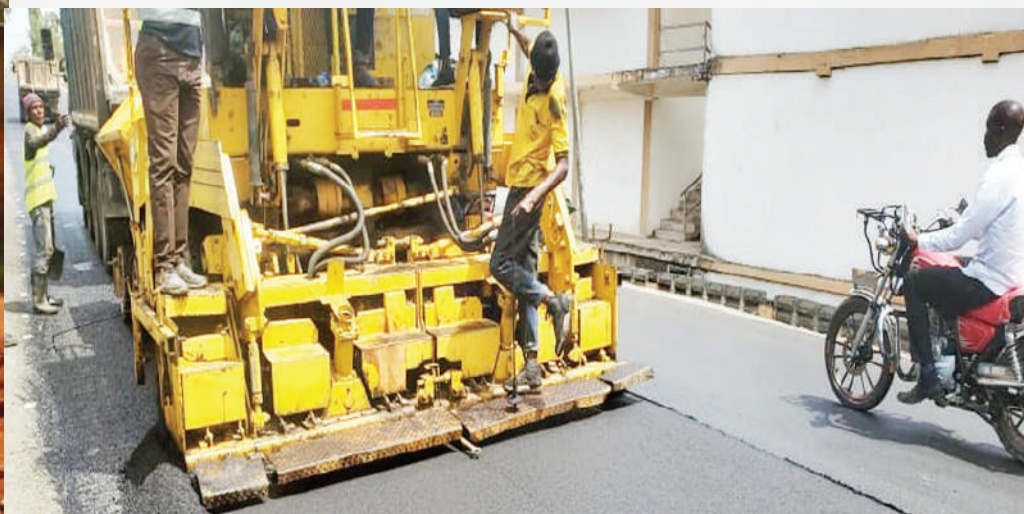
Kuongeza tabaka la juu la lami kwenye barabara ya Mecco- Buzuruga (1.2km) gharama Sh. 399,931,500.00/=