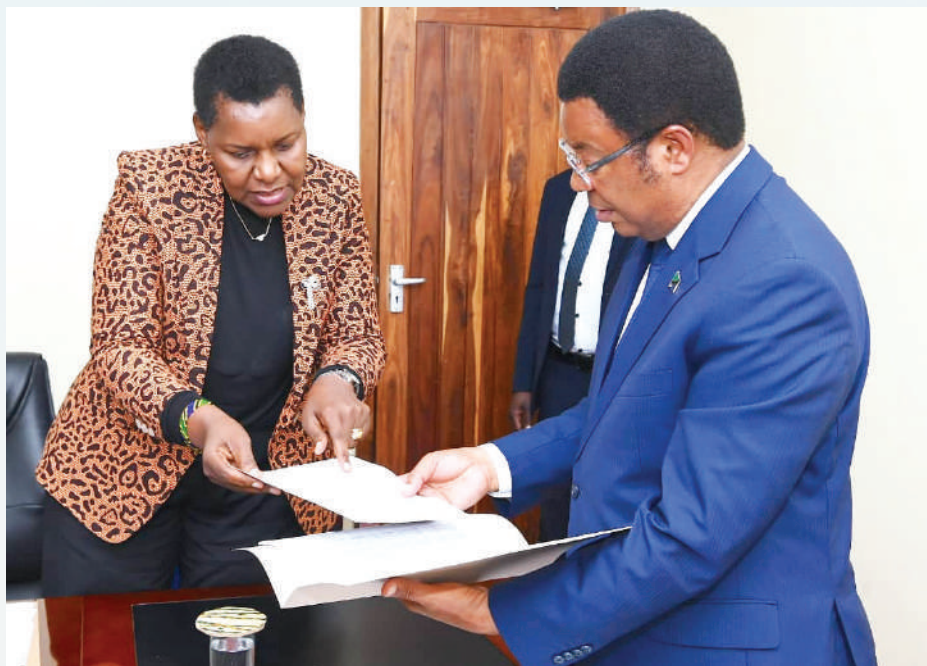
Mbunge wa Ilemela na Waziri wa Ardhi akitoa ufafanuzi wa jambo kwa Mhe Kassim M. Majalia waziri mkuu