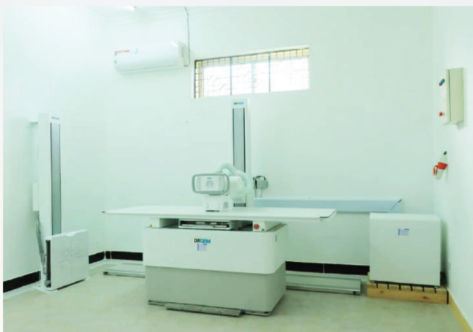
Mashine mpya ya mionzi (X – Ray) iliyopokelewa katika Hospital ya wilaya