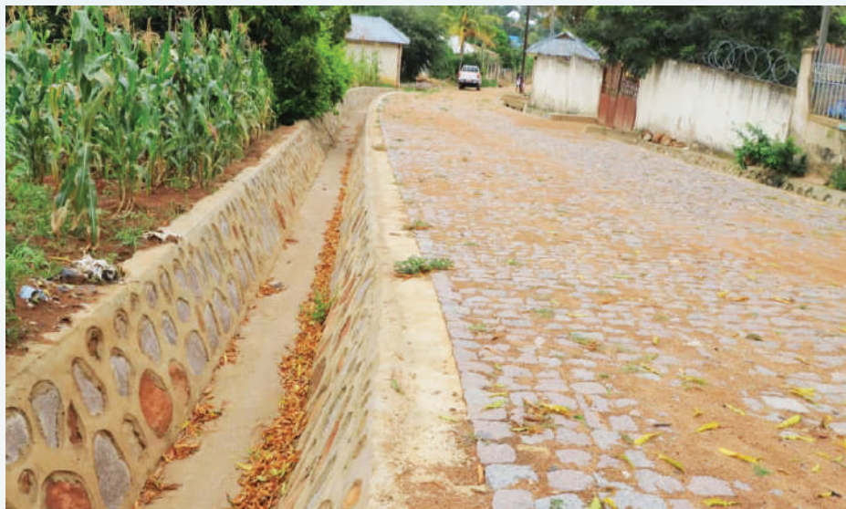
Ujenzi wa barabara ya mawe Mkudi kata ya Nyasaka