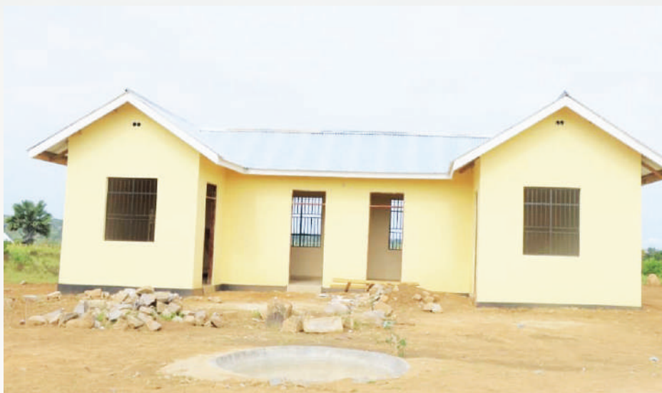
Ujenzi wa Ofisi ya serikali ya Mtaa wa Nyamiswi kata ya Sangabuye ujenzi unaendelea

Ilani ya uchaguzi ya CCM ya 2020/2025 katika ibara ya 122 inaielekeza Serikali katika kipindi cha miaka mitano kuhakikisha kuwa serikali za mitaa zinazidi kuboreshwa kwa lengo la kuinua ubora wa huduma kwa wananchi. Kwa kuzingatia uhitaji na utekelezaji wa Ilani kama ilivyoelekezwa katika Ibara 122(I), kwa kushirikiana na viongozi wa serikali za mitaa katika kuhakikisha wanakuwa na mazingira bora ya kufanyia kazi, ofisi ya Mbunge ilitoa jumla ya tofali 12,600 zenye thamani ya shilingi 12,600,000.00 nakuzigawa katika mitaa mbalimbali kwa ajili ya ujenzi wa ofisi za mitaa jimboni. Uboreshaji wa ofisi za serikali za mitaa utaendelea kufanyika hadi hapo mitaa yote 171 itakapo kuwa imekamilika kujengwa. Ujenzi wa ofisi hizi unafanyika kwa ushirikiano wa pande tatu kamba ambavyo kauli mbiu ya Jimbo inataka “Ilemela ni Yetu, Tushirikiane kujenga” kwa maana ya Wananchi, Mbunge na Serikali., Mgao wa tofali tajwa hapo juu umefanyika kama ifuatavyo;