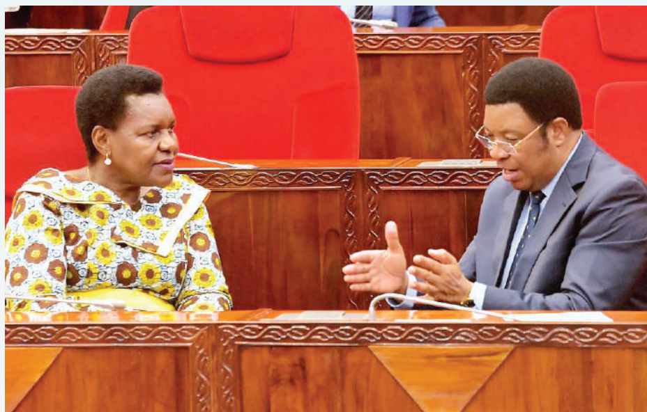
Maelezo ni Waziri wa ardhi Dkt Angeline Mabula akipata maelekezo kutoka kwa waziri mkuu Mhe Kassim Majaliwa Majaliwa