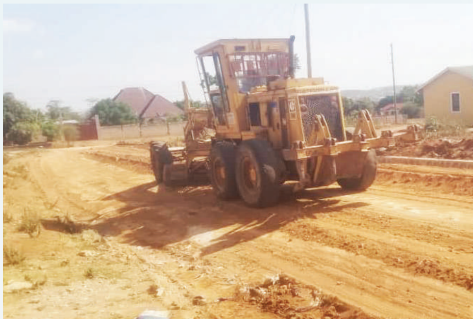
Ujenzi wabarabaraya Nyakurunduma (0.78KM) na barabaraya Nyamanoro - Msikitini (1.5KM) kwa kiwango cha changarawe