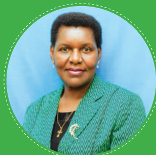
Mhe. Dkt. Angeline S.I Mabula (Mb)

Mbunge wa Ilemela na Waziri wa Ardhi Nyumba na Maendeleo ya Makazi (MNEC)