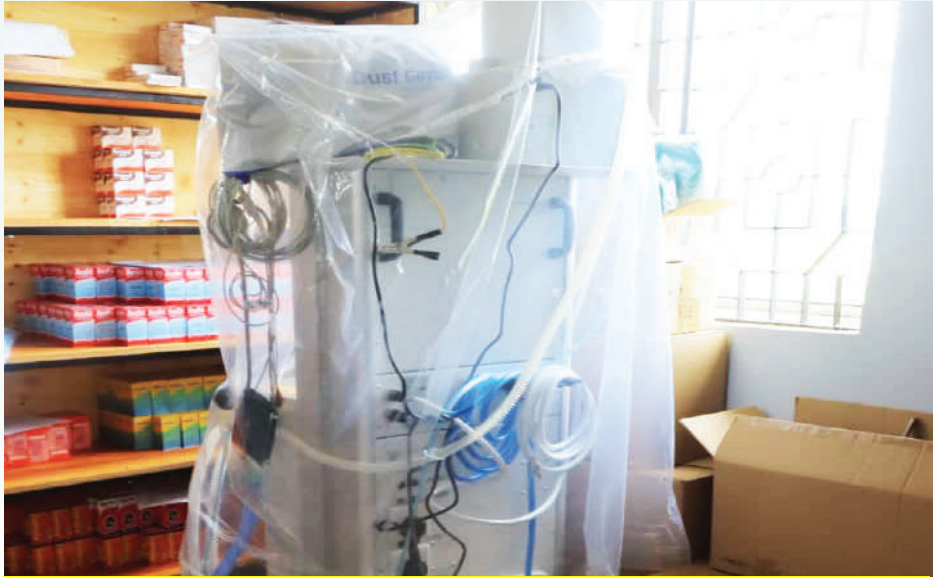
Mashine ya Utrasound (Univerisal anesthetic) ktk Hospital ya wilaya