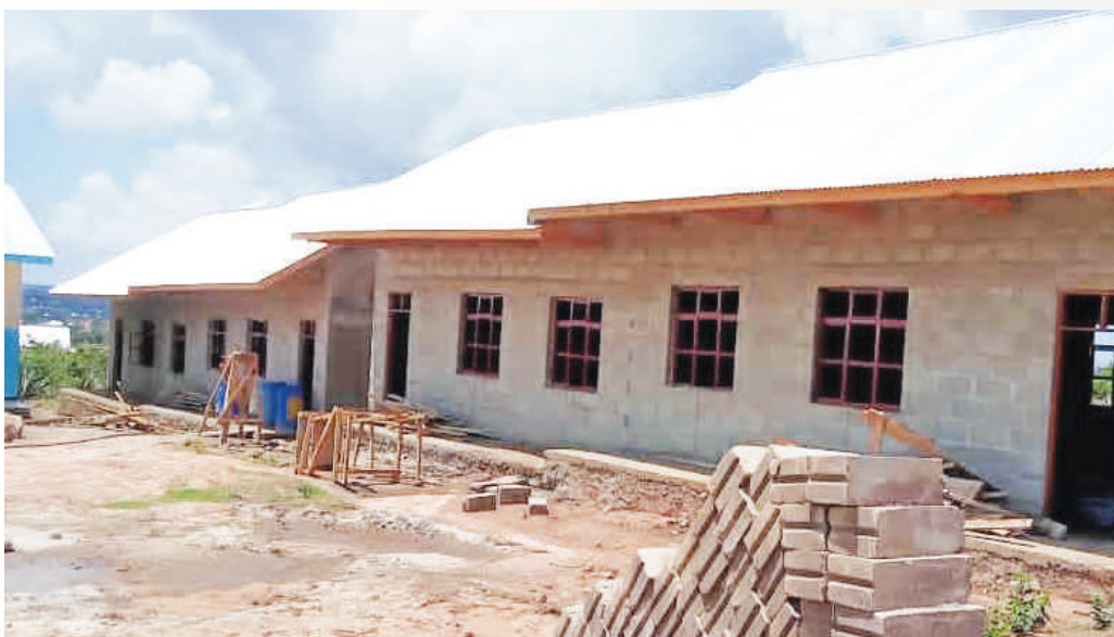
Ujenzi wa Vyumba vya madarasa Shule mpya ya Sekondari Igogwe kwa Fedha za TASAF