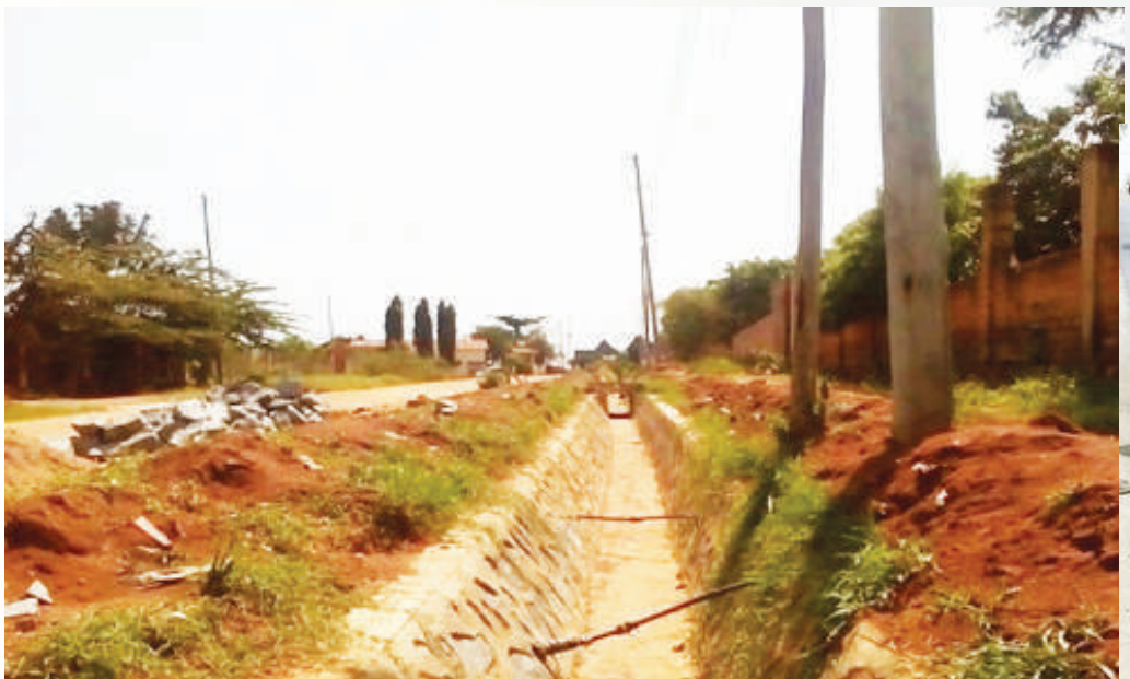
Ujenzi wa mitaro barabara ya Pasiansi-Lumala-Kiseke Kata ya Kawekamo/ Ilemela/Kiseke