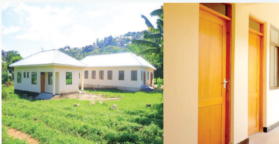
Muonekano wa ndani, Nyumba ya mtumishi na Jengo la Zahanati ya Mihama Kata ya Kitangiri

Ujenzi wa zahanati ya Mihama ulianza kufatia vikao vya mtaa wa Mihama kuona umuhimu wa kuwa na Zahanati kutokana na kuwa mbali na mjini na imezungukwa na shughuli za uvuvi ambapo magonjwa kama kichocho na malaria huwapata mara kwa mara. Mara baada ya wananchi kuanzisha ujenzi huu kwa kuchimba msingi na kununua mawe na kokoto ofisi ya Mbunge ilipeleka mifuko 50 ya saruji yeny thamani ya sh 1,000,000 . Ujenzi unaendelea kwa ufadhili wa TASAF. Tunawashukuru Tasaf kwa kuamua kushirikiana na wananchi katika ujenzi wa zahanati ambayo itakapokamilika itahudumia wakazi wa Mitaa ya Mihama, Jiwe kuu