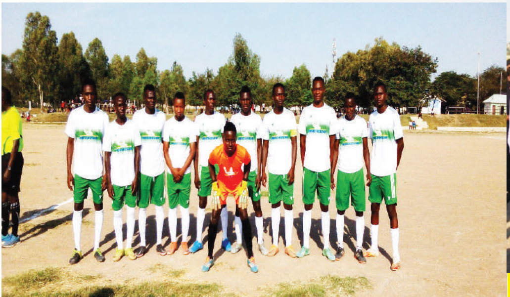
Timu ya mpira Kata ya Ilemela washindi wa The Angeline Jimbo Cup 2022