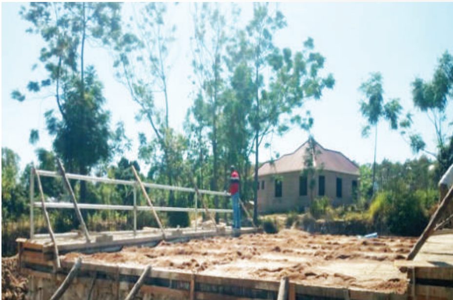
Matengenezo makubwa/ Ujenzi wa madaraja ya Kagenzi na Iponyabugali Kata ya Kayenze kwa gharama Sh. 98,539,560/=