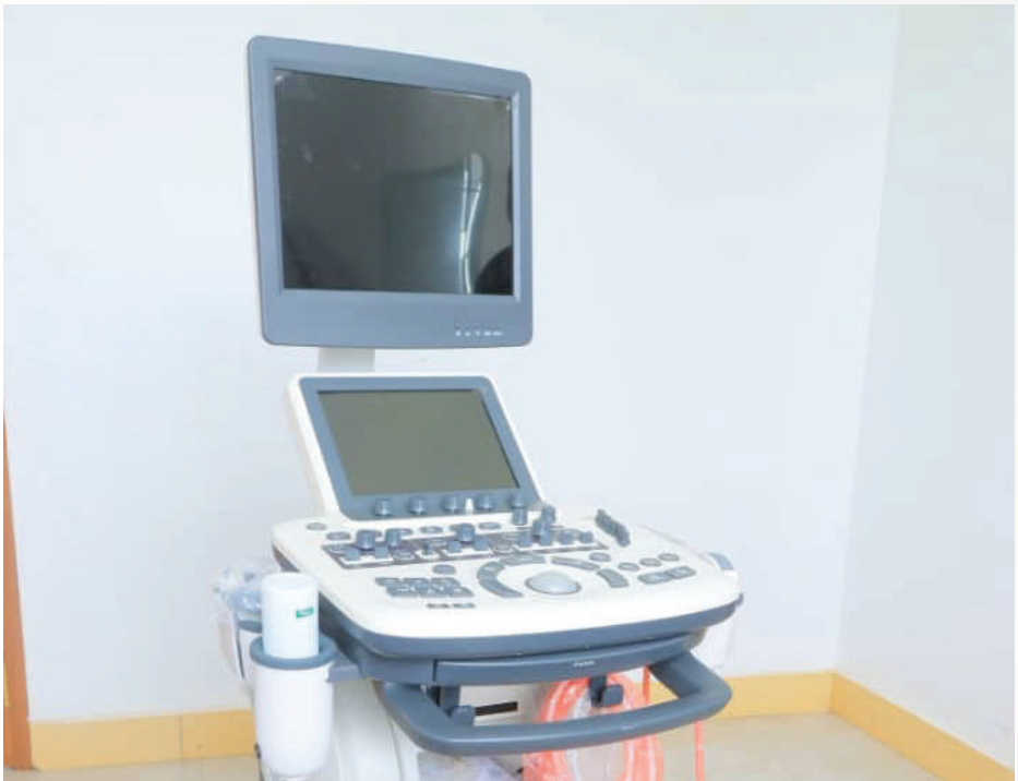
Mashine mpya ya mionzi (X – Ray) katika Hospital ya wilaya mtaa wa Isanzu