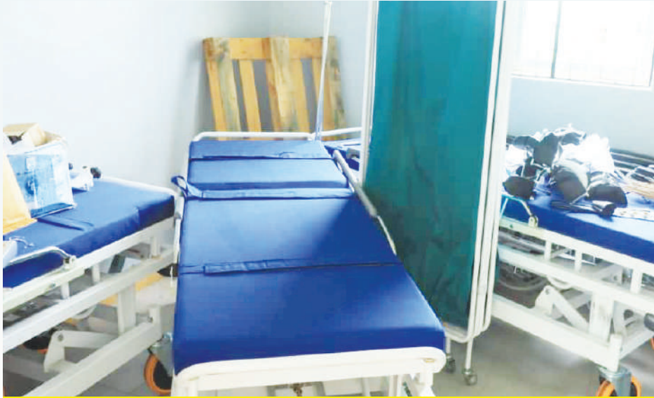
Vitanda vya vipya vya hospital vilivyotolewa na serikali kuu