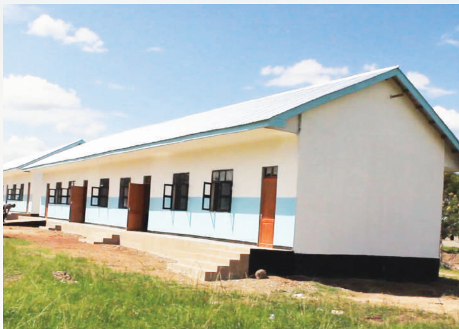
Shule ya msingi Shibula kata ya Shibula

Ibara ua 16 ya ilani ya uchaguzi imeitaka serikali kuimarishwa na kuendelezwakwa mifuko mbalimbali na programu, Maalum za kusaidia wananchi wenyekipato cha chini na wenye, Mahitaji maalum ili waweze kuondokana na umasikini. Lengo likiwa ni kuhakikisha wanafunzi wote wanaohitimu darasa la sabana kufaulu wanaanza masomo yao kwa wakati nakatika mazingira rafiki kwa kipindi cha miaka miwili uboreshaji miundombinu shule za msingi, jumlaya shule mpya tano zimeanzishwa ambazo ni; 1) Shule ya msingi Buyombe Kata ya Kahama, 2) Shule ya Msingi Bujingira Kata ya Buswelu, 3) Shule ya msingi Kangae kata ya Nyakato, 4) Shule ya msingi Kahama kata ya Kahama na 5) Shule ya msingi Shibula kata ya Shibula