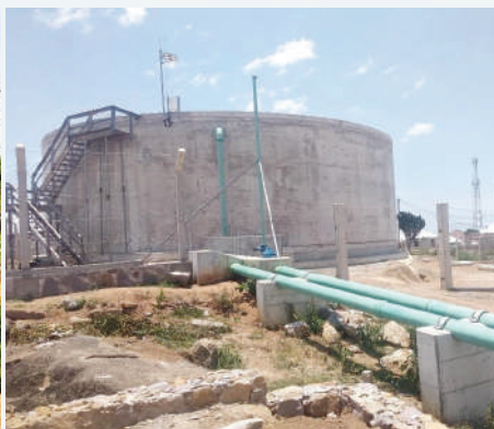
Tenki la Nyasaka lenye ujazo wa lita 1,200,000