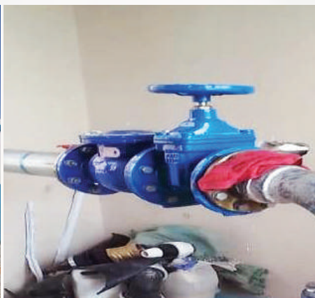
Ufungaji wa pampu kwenye Kituo cha kusukuma maji -mlima wa Rada