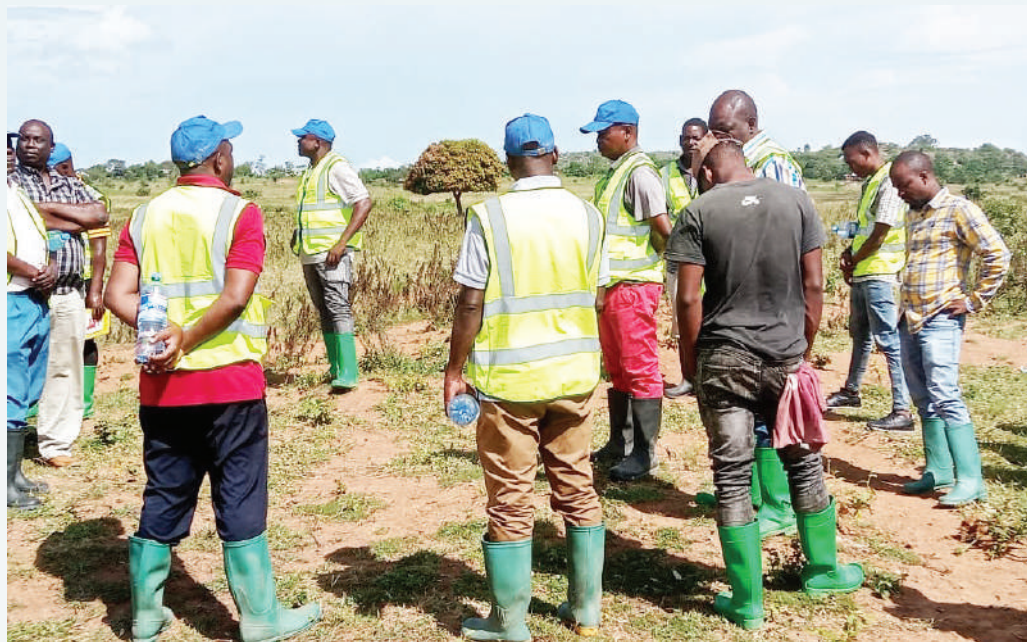
Vijana wakiwa kazini tayari kwa kazi ya kupima viwanja katika eneo la mradi