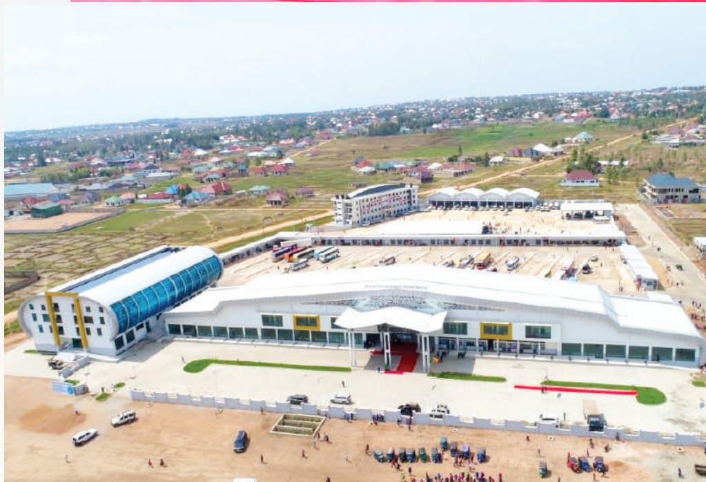
Muonekano wa Standi mpya ya Bus, Maegesho ya Malori na Hostel katika Kata ya Nyamhongolo.