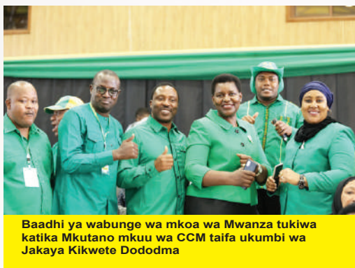
Baadhi ya wabunge wa mkoa wa Mwanza tukiwa katika Mkutano mkuu wa CCM taifa ukumbi wa Jakaya Kikwete Dododma