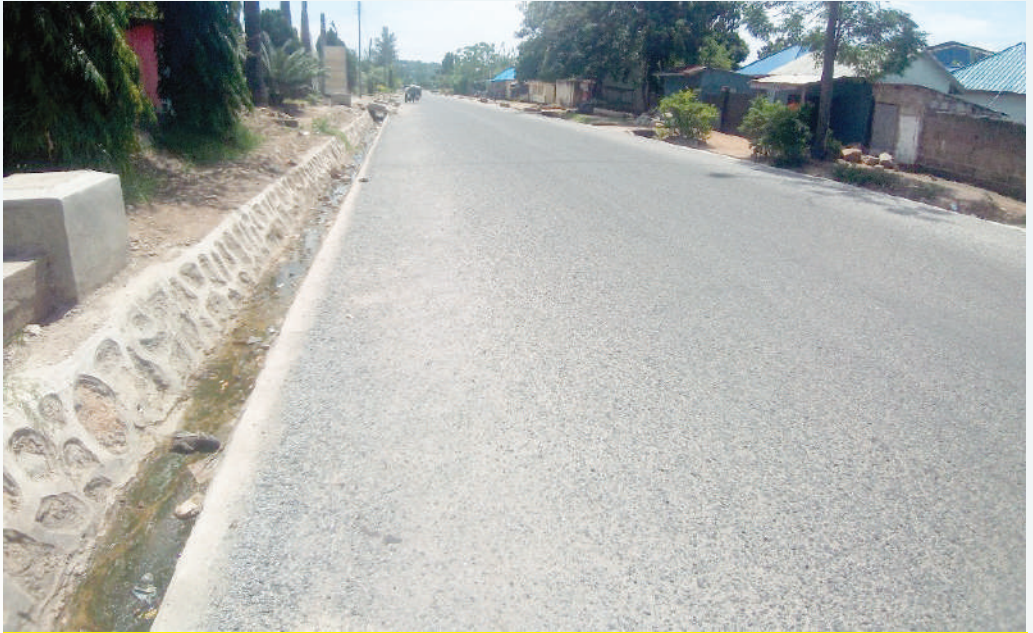
Ujenzi wa barabara ya Breweries (1km) kwa kiwango cha lami kwa gharama ya Sh 499,953,596.20