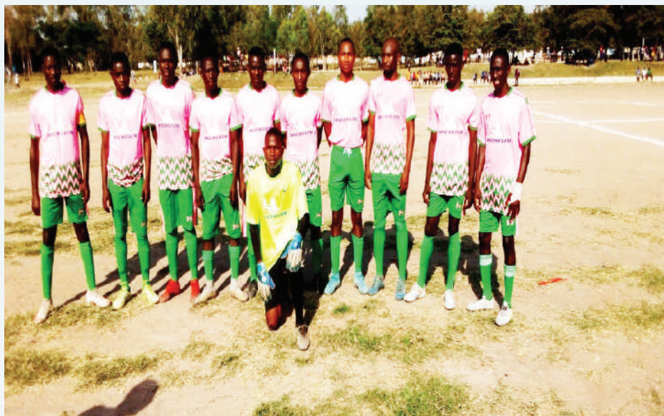
Timu ya kata ya Buzuruga iliyoshiriki The Angeline Jimbo Cup 2022