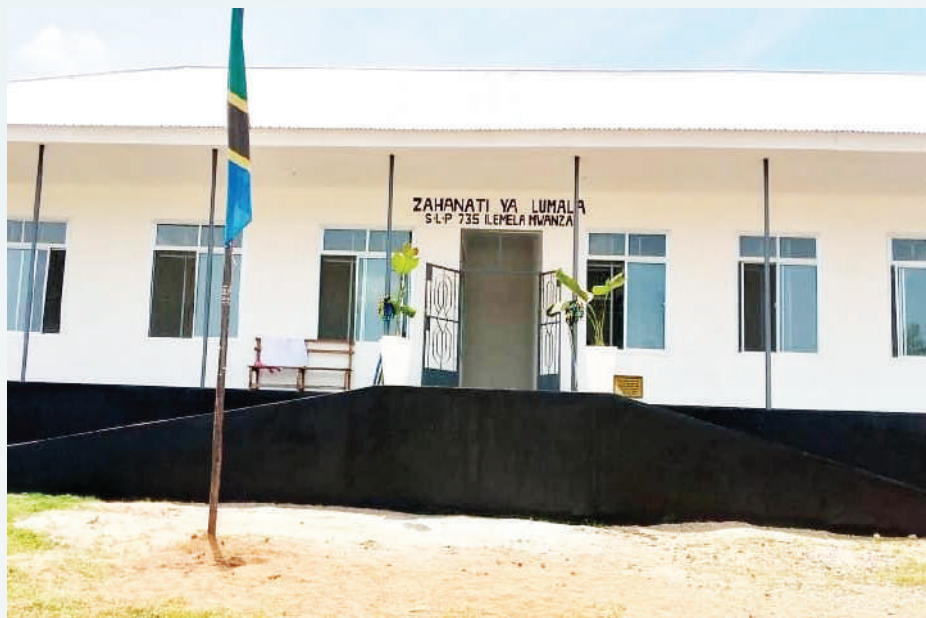
Zahanati ya Lumala ujenzi umekamilika na inatumika