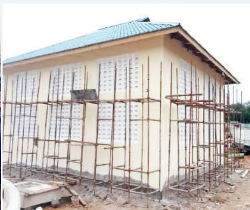
Ufungaji wa pampu kwenye kituo cha kusukuma maji cha Kiseke