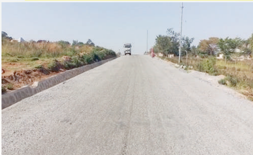
Ujenzi wa barabara ya kabuhoro-ziwani kwa kiwango cha lami Kata ya Kitangiri/Kirumba