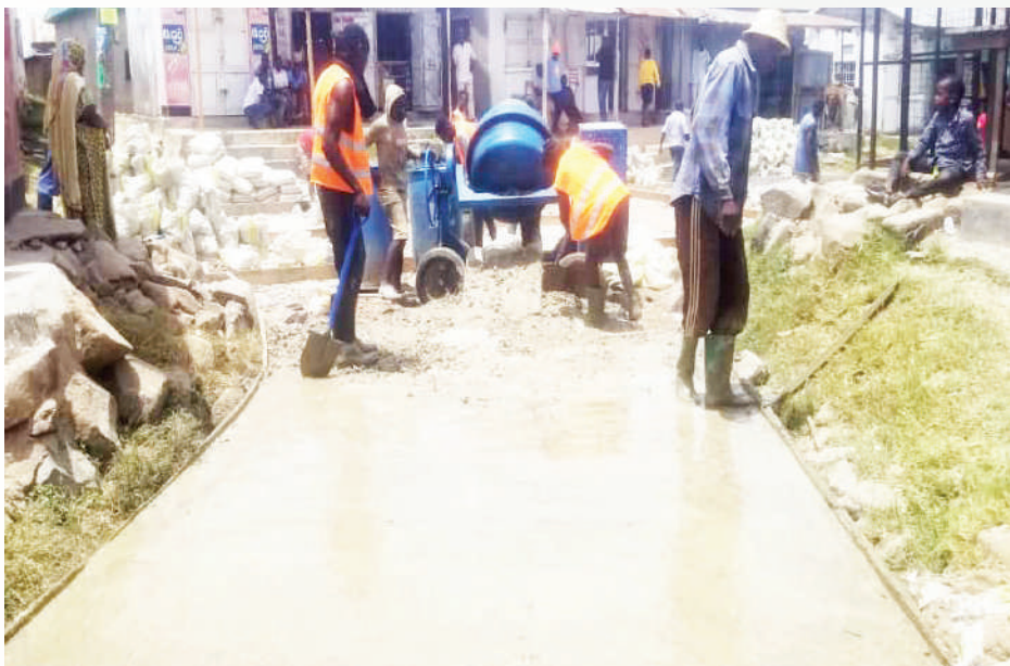
Ujenzi wa mitaro na kalvati barabara ya Nyamanoro-Msikitini Kata ya Ibungilo Ujenzi wa barabara ya Igombe-Ziwani kwa kiwango cha zege Kata ya Bugogwa