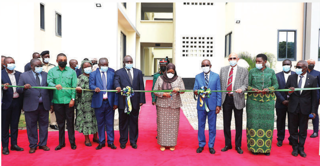
Rais wa Jamhuri ya Muungano wa Tanzania Mheshimiwa Samia Suluhu Hassan akikata utepe kuzindua mradi wa Nyumba 644 zilizojengwa na Serikali kupitia Wakala wa Majengo Tanzania TBA katika eneo la Magomeni Kota Mkoani Dar es Salaam leo tarehe 23 Machi, 2022.