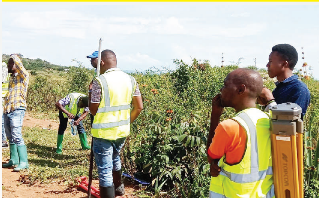
Watumishi wa idara ya ardhi ilemela wakiwa uwandani kupima viwanja