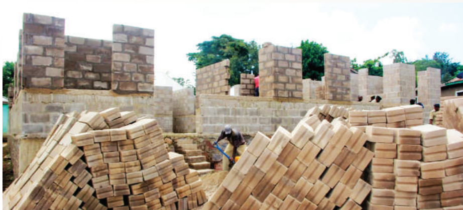
Ujenzi wa Zahanati ya Nyambiti kata ya Buzuruga unaendelea