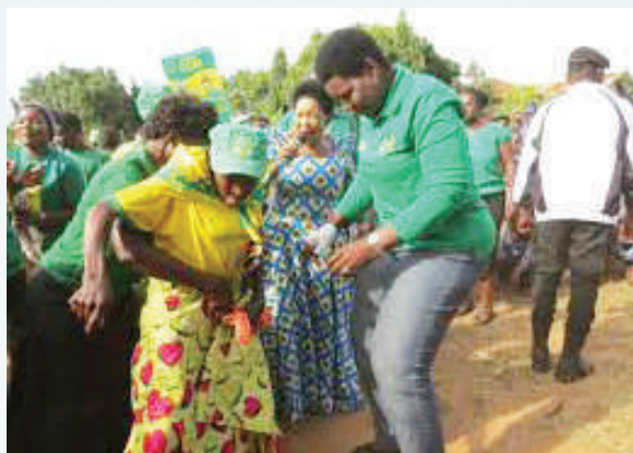
Mmoja wa wapenzi na wakereraketwa wa CCM akisakata rumba na mgombea wa CCM katika uchaguzi Mkuu 2020