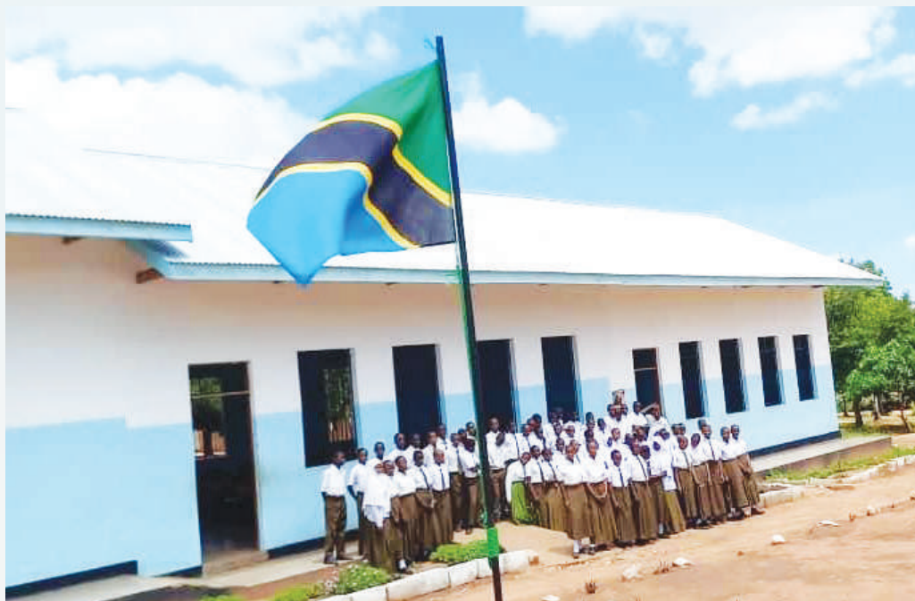
Shule mpya ya Sekondari ya Masanza kata ya Kahama