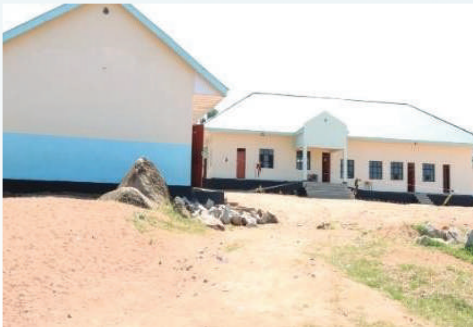
Shule mpya ya Sekondari ya Buzuruga imeanza kutumika pamoja na kuwa ujenzi wa baadhi ya miundombinu unaendelea