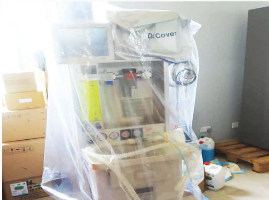
Mashine ya Usingizi (Univerisal anesthetic) ktk Hospital ya wilaya