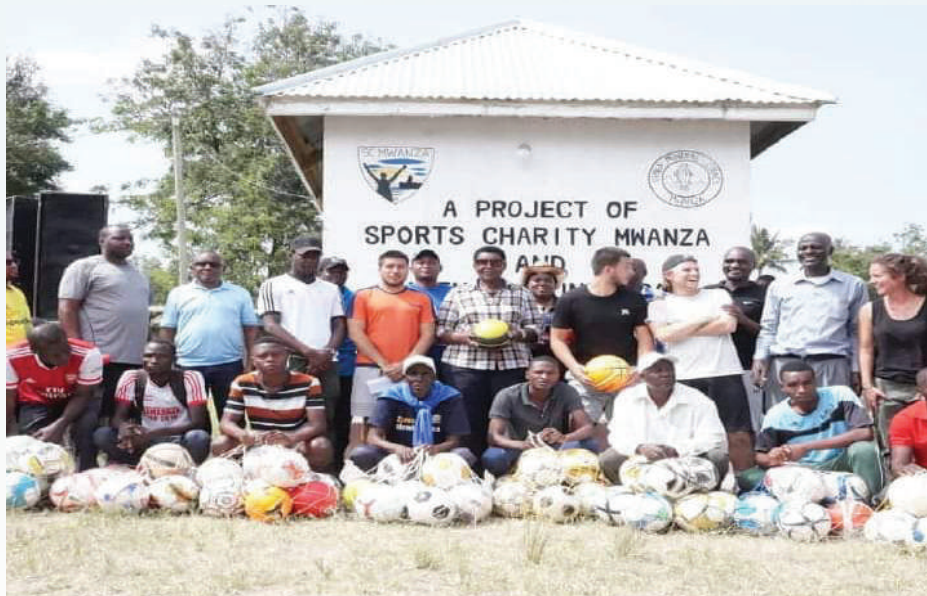
Baadhi ya viongozi wa vilab mbalimbali vya michezo walionufaika na msaada wa mipira toka kwa volunteer waliojenga miundombinu ya viwanja vya michezo Sabasaba.