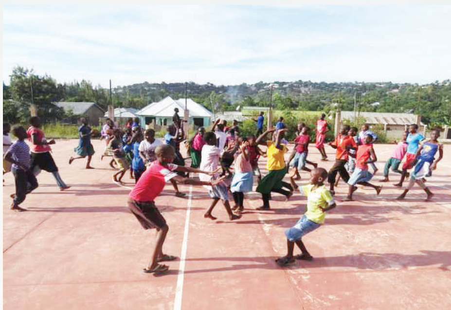
Vijana wadogo wakiandaliwa kuwa wachezaji wa mpira wa kikapu, wekeza kwa vijana ili kulea vipaji kwa baadae.