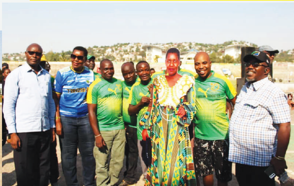
Baadhi ya viongozi wa Chama na Serikali pamoja na Makatibu wenezi wa CCM ngazi ya Kata walioshiriki katika uhamasishaji wa timu katika kata zao.