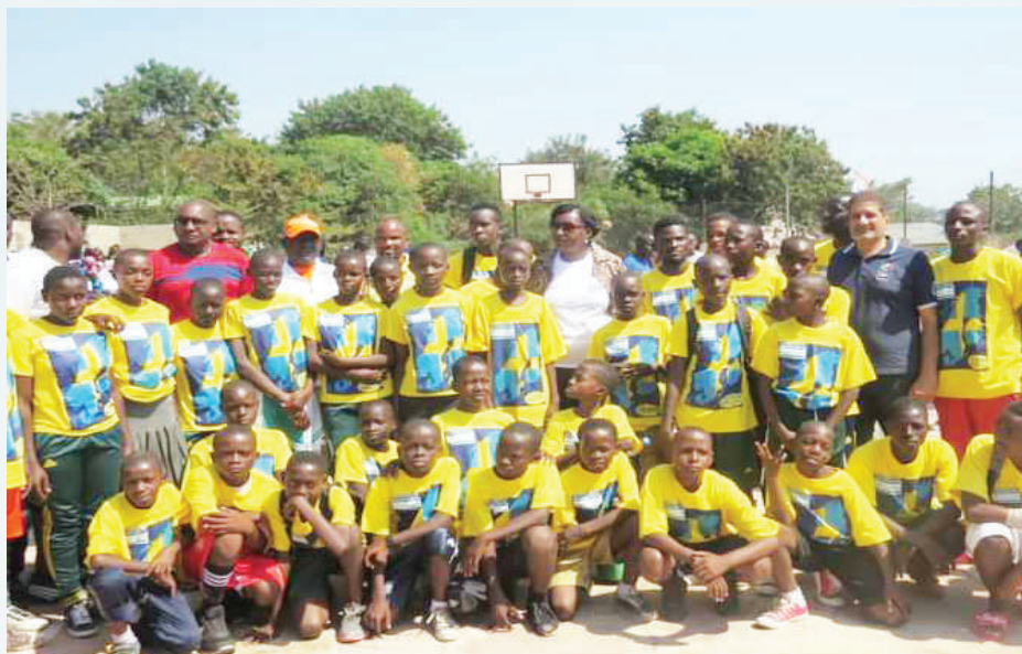
Tunawekeza kwa vijana ili kukuza vipaji, katika picha ni vijana chipukizi katika mchezo wa mpira wa kikapu wilaya ya Ilemela