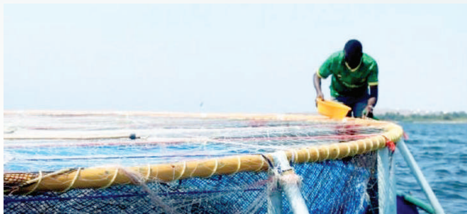
Mradi wa Vijana wa ufugaji wa Samaki kwa njia ya Vizimba Mtaa wa Igalagala, Kata ya Sangabuye.

kipaumbele kwa vijana kujiunga. Aidha jumla Sh 296,647,780.00 zimetumika kati yake sh 114,148,780.00 fedha toka serikali kuu na sh 182,499,000.00 toka mapato ya ndani kwa mgawanyo ufuatao; Ukarabati wa Mwalo Kayenze sh 45,225,176.00 , Ukarabati mwalo wa Kayenze ndogo Sh 85,348,780.00 OC ya idara sh 28,800,000.00 , Ukarabati wa miundombinu ya soko la samaki Sh 43,600,000.00 na uendeshaji ofisi Sh 47,301,000.00 . Aidha mafunzo ya ufugaji samaki kwa vyama vya ushirika 11 vyenye washirika 48 wamenufaika na mafunzo. Vikundi hivi vinategemea kupata vizimba vyenye thamani ya sh 3,859,899,200.00