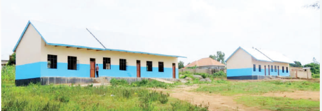
Shule mpya ya msingi Kangae picha ya juu ni vyumba vya madarasa, picha ya chini vyoo cha watoto wa shule