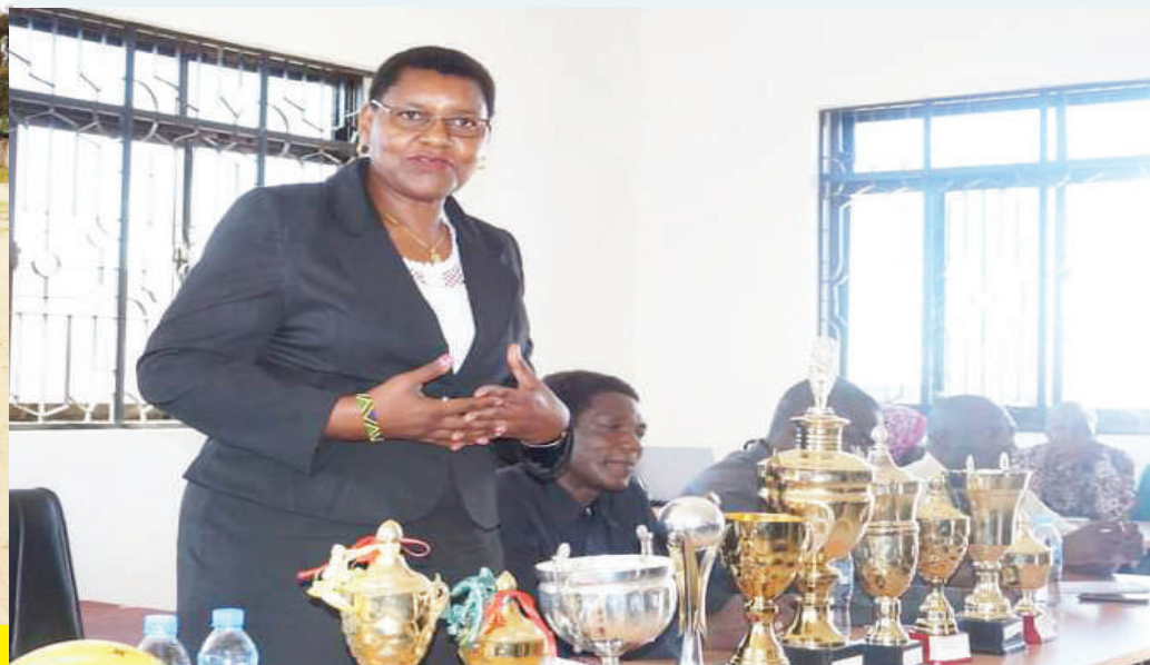
Utambulisho wa zawadi za mashindano ya mpira mbali na fedha taslimu zitolewazo kwa washindi wa mashindano kila mwaka